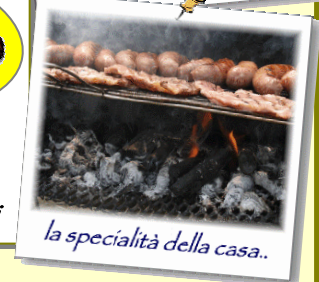
la specialità della casa..