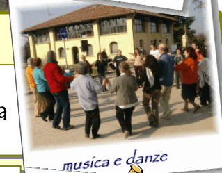
musica e danze