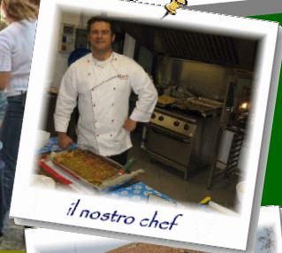
il nostro chef